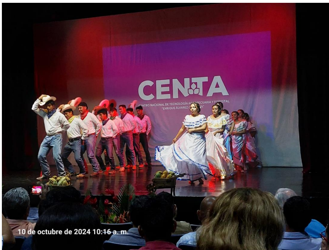
Ilustración 5: Grupo de danza participa en evento día internacional del Cacao

Como parte de las actividades que desarrolla el comité deportivo, científico y cultural se encuentra la conformación y organización del grupo de danza IENS-ENA, en el que participan estudiantes de diferentes años de estudio.