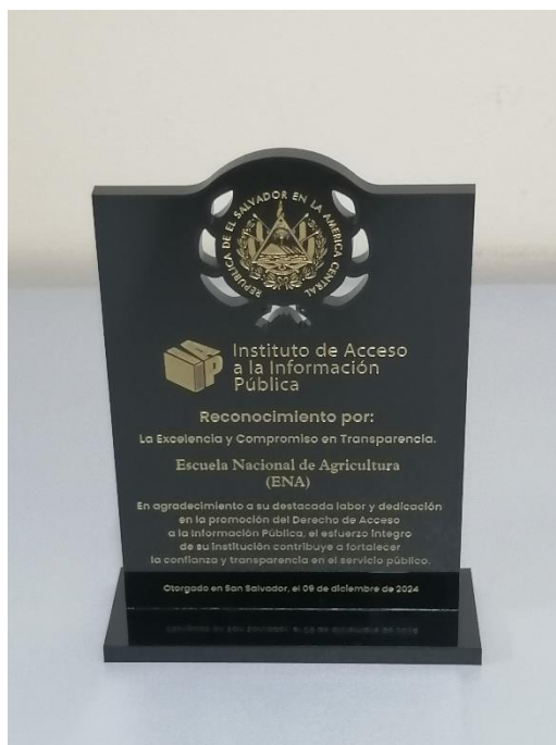
Ilustración 6: Reconocimiento por la excelencia y transparencia

El día 9 de diciembre del 2024, el Instituto Especializado a Nivel Superior, Escuela Nacional de Agricultura, tuvo el honor de ser distinguido con reconocimiento por su destacada labor en materia de transparencia.