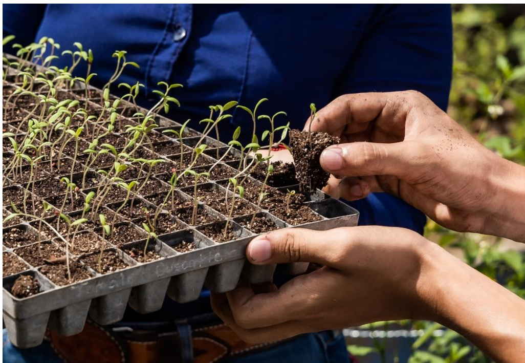
Ilustración 1: Taller de Huerto Escolar

Resultados de docencia, investigación y proyección social