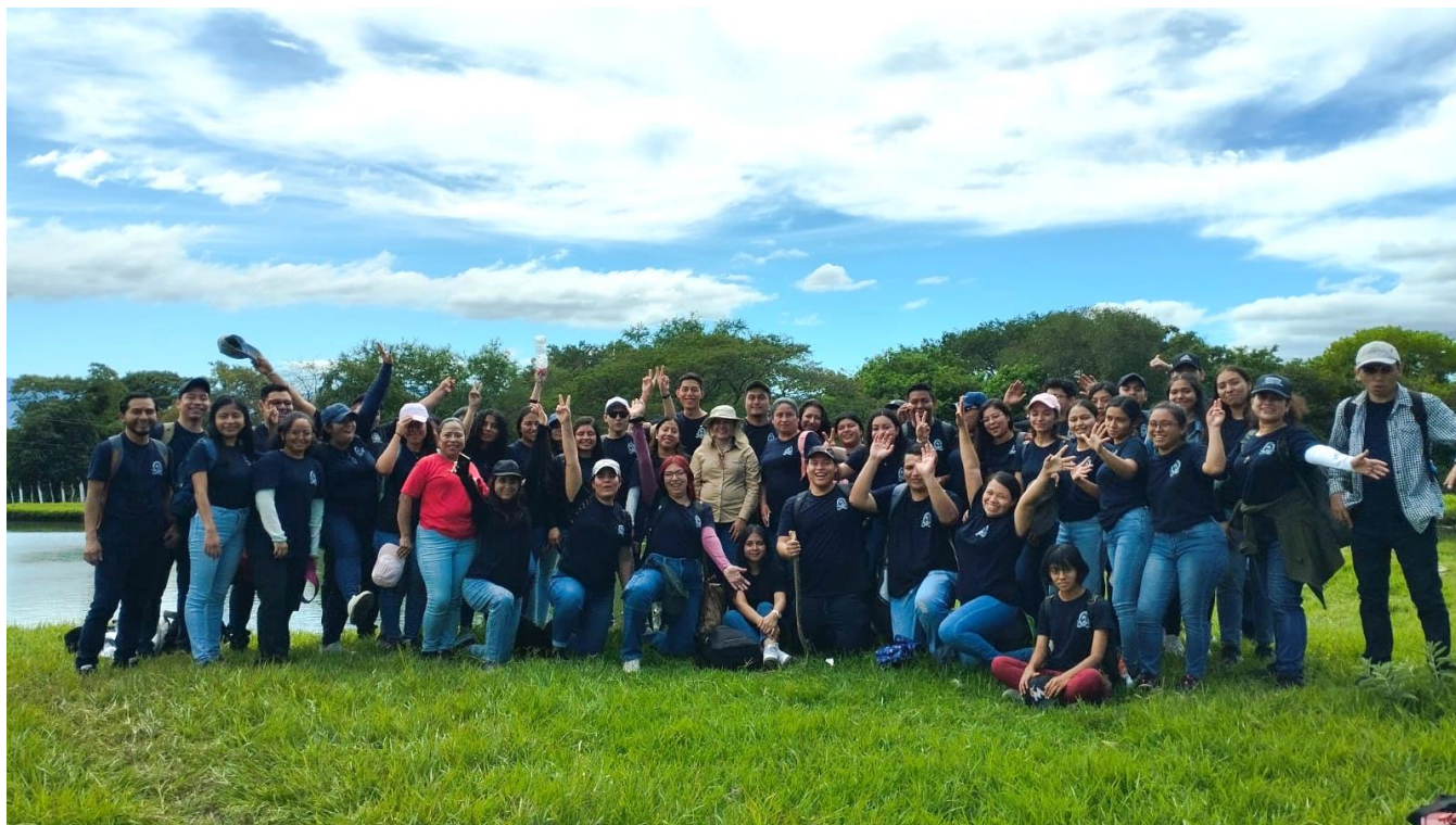
Ilustración 2: Visita de la Universidad de El Salvador

La Unidad de Proyección Social atendió a 375 personas, 131 hombres y 244 mujeres, que visitaron las distintas áreas de campo de la IENS-ENA, conociendo así, el modelo educativo.