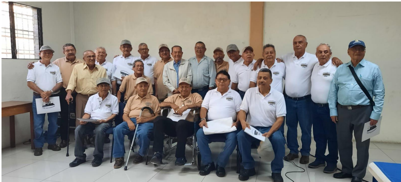
Ilustración 3: Promoción XVII celebrando su aniversario N°50

Como parte del seguimiento de graduados el siete de diciembre del 2024; los agrónomos de la promoción XVII celebraron el 50 aniversario de su acto de graduación. Esta promoción se graduó el 7 de diciembre del año 1974 y por primera vez en cincuenta años logran reunirse. Fueron 55 estudiantes que obtuvieron el título de agrónomo, de ellos 14 ya fallecieron.